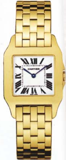
"Santos Demoiselle" von Cartier, um 10700 Euro