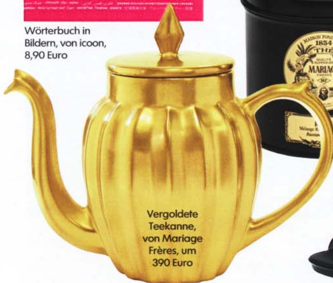
Vergoldete Teekanne, von Mariage Frères, um 390 Euro