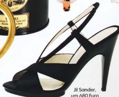
Jil Sander, um 680 Euro