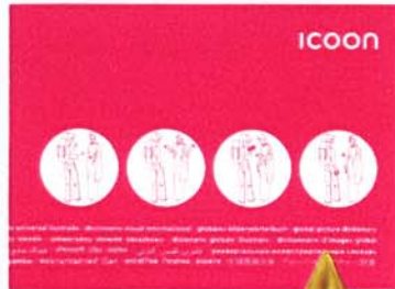
Wörterbuch in Bildern, von icon, 8,90 Euro