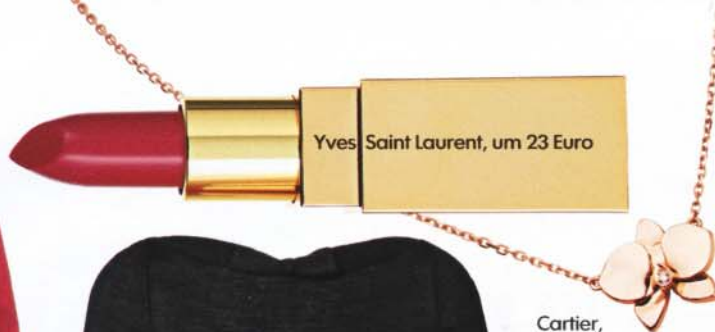
Yves Saint Laurent, um 23 Euro