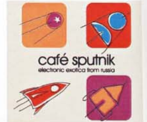
CD, Eastblok Music, um 14 Euro