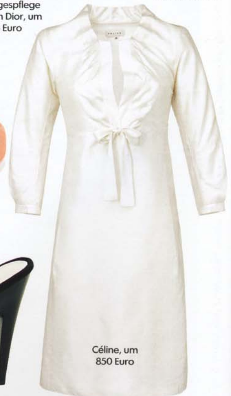
Céline, um 850 Euro