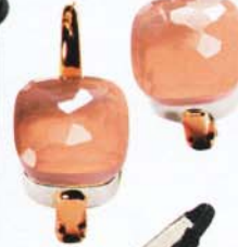
Ohrringe "Nudo" von Pomellato, um 1390 Euro