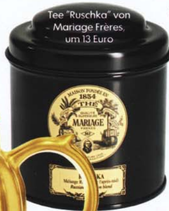
Tee "Ruschka" von Mariage Frères, um 13 Euro