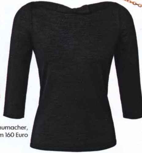
Schumacher, um 160 Euro