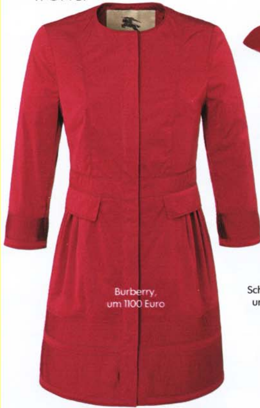
Burberry, um 1100 Euro