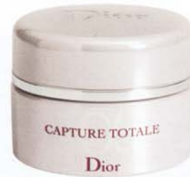
Tagespflege von Dior, um 123 Euro

ST. PETERSBURG In den restaurierten Luxuskaufhäusern am Newski Prospekt tummeln sich die Global Shopper: St. Petersburg gilt als neue Stilmetropole. Besonders wichtig: Etikettel Der Look zum Tee mit Piroggen (Gebäck) im früheren Zarenpalais "Taleon Imperial": Rüschenkleid oder Faltenrock mit farblich abgestimmtem Satinmantel. Immer angesagt: Goldschmuck und Statusuhr (Best Buy: Cartiers "Santos Demoiselle"). Dresscode abends: superchic. Zur Ballettgala im Mariinski-Theater trägt man Robe und Satinhandschuhe. Beauty: Eine Top-Maniküre gehört einfach zum Luxus-Outfit.