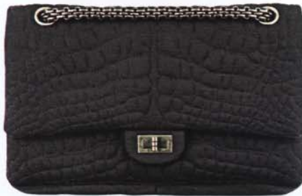
Chanel, um 2100 Euro

ST. PETERSBURG In den restaurierten Luxuskaufhäusern am Newski Prospekt tummeln sich die Global Shopper: St. Petersburg gilt als neue Stilmetropole. Besonders wichtig: Etikettel Der Look zum Tee mit Piroggen (Gebäck) im früheren Zarenpalais "Taleon Imperial": Rüschenkleid oder Faltenrock mit farblich abgestimmtem Satinmantel. Immer angesagt: Goldschmuck und Statusuhr (Best Buy: Cartiers "Santos Demoiselle"). Dresscode abends: superchic. Zur Ballettgala im Mariinski-Theater trägt man Robe und Satinhandschuhe. Beauty: Eine Top-Maniküre gehört einfach zum Luxus-Outfit.